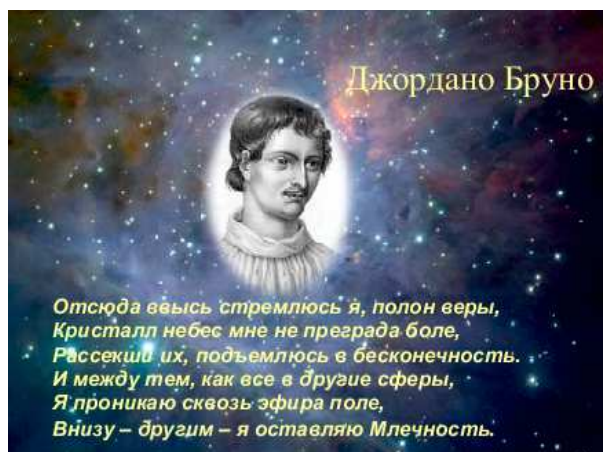
Постер к вечеру о жизни Джордано Бруно