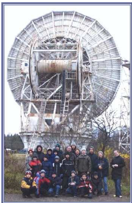
Активные участники работы Детского центра SETI