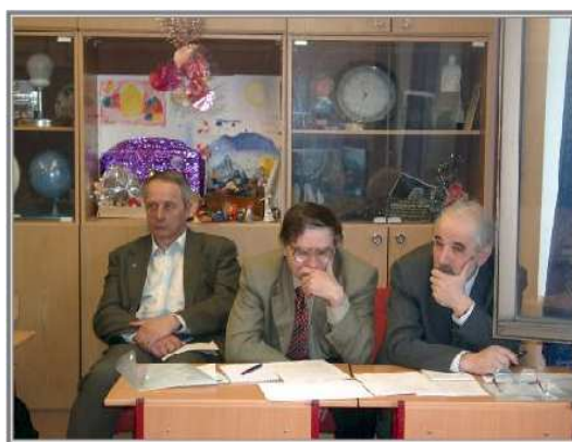
Высокое жюри оценивает