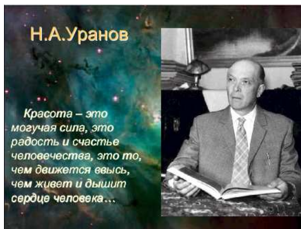
Постер к вечеру о жизни Н.А.Уранова