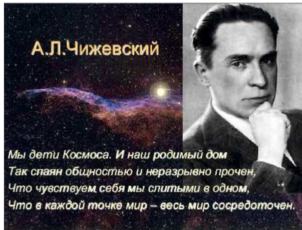
Постер к вечеру о А.Л.Чижевском